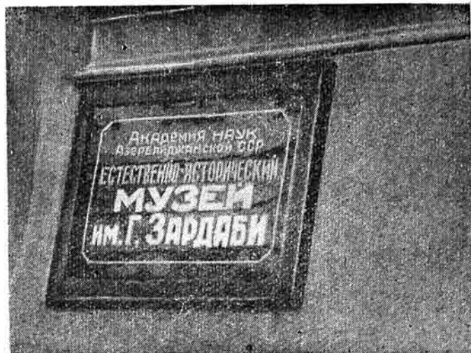
А. ССР ҒА Һ. Зәрдаби адына Тәбиийәт мұзейинин бинасы