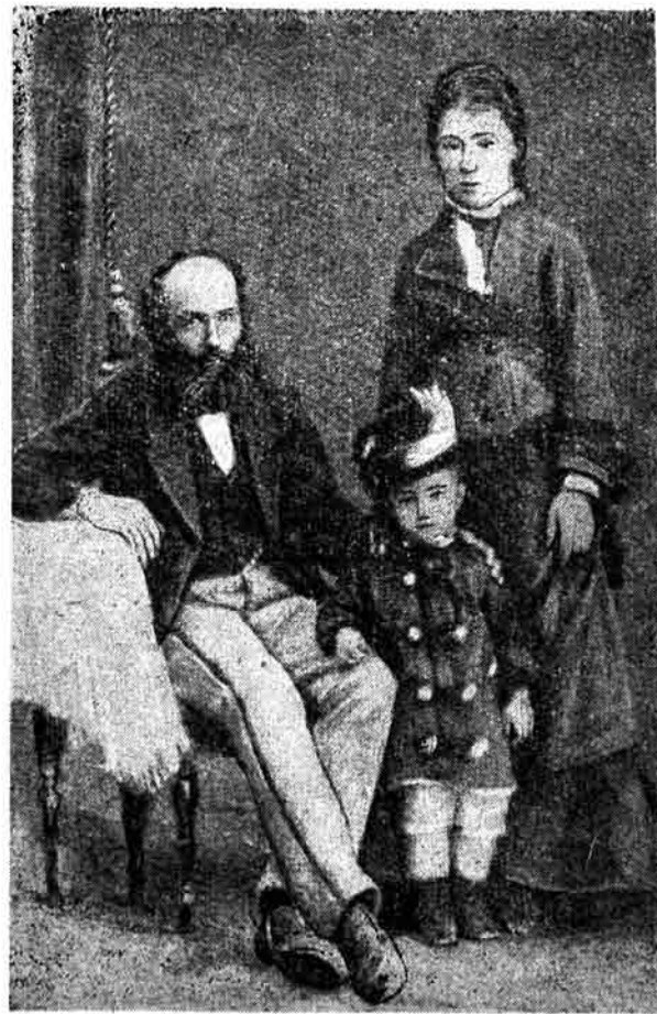
Һәсәнбәй, һәнифә ханым вә гызынын бирликдә шәкли.