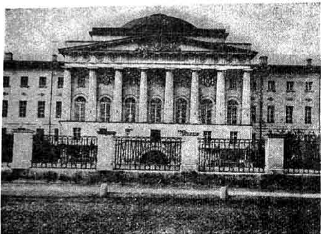
Һәсәнбәйиң гуртардығы Москва университетиниң бинасы.

чалышмын вә бу фикирләрин чарчысы кими чыхыш этмишләр. Һәсәнбәй Мәликов да белә бир ичтимаң мүнхтдә тәһсил алмыш вә азадлығ идеяларының яйылмасында яхындан иштирак этмишдир. Һәсәнбәйиң Москва университетиндә тәһсил алдығы дөвр—Һәмин университетдә азадлығ, ингиләби-демократик идеяларын вә гүввәләрин мүртәчә идея вә гүввәләрә гаршы мубаризәсиниң кәскинләшдийи бир вахта тәсадүф эдир. Москва университетиниң зоолокия кафедрасының мүдири А. П. Богданов 1858-чи илдән Һәсәнбәй Мәликовун мүәллими олмушду. Русияда илк дарвинист олан Богданов исте-дадлы алим, педагог вә бачарығлы тәшкилатчы иди.