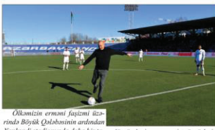
Ölkəmizə erməni faşizmi üzərində Böyük Qələbəsinin ardından Xankəndi stadionunda daha bir tarixi qələbə qazanıldı. Azərbaycan Respublikasının Prezidenti İlham Əliyevin Ali Baş Komandanı Cənab İlham Əliyevin topa rəmzi toplaşması ilə başlanmış "Qarabağ" MOİK oyunu bütün dünyaya Böyük Zəfərimizi futbol dili ilə dəstəklən edən: top artıq Azərbaycanca, onun gücü zəhərlənədir!

Futbol 90 dəqiqədir və nəticəsi nə olursa-olsun, həmişə qazanan idman, fiziki sağlamlıq, sağlam düşüncə və insanlar arasında sülh və sevgi hissləridir. Odur ki, qalib