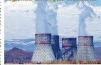
Metamor Atom Elektrik Stansiyasının (AES) tikintisi başlandı.