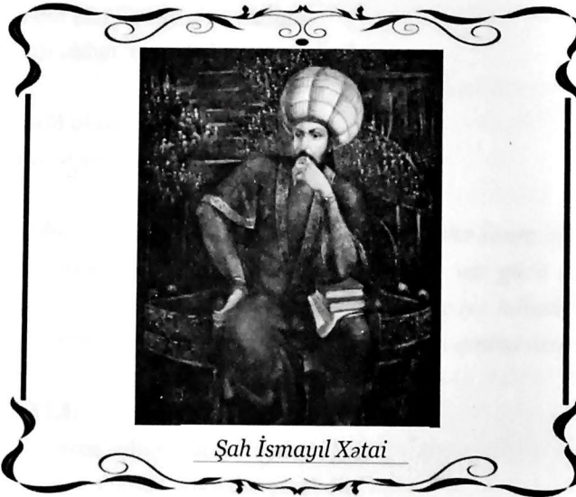
Şah İsmayıl Xətai