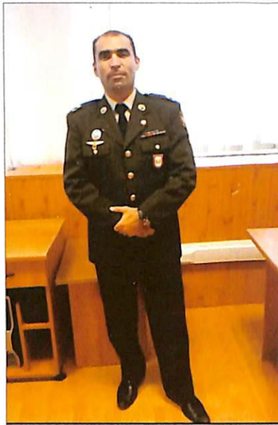
Mayor Qalib Hümbətov