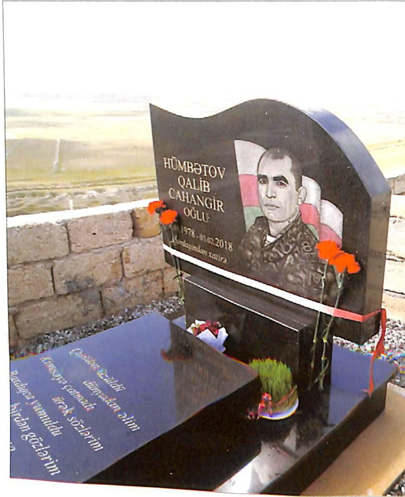
Qalib Hübətovun son mənzili