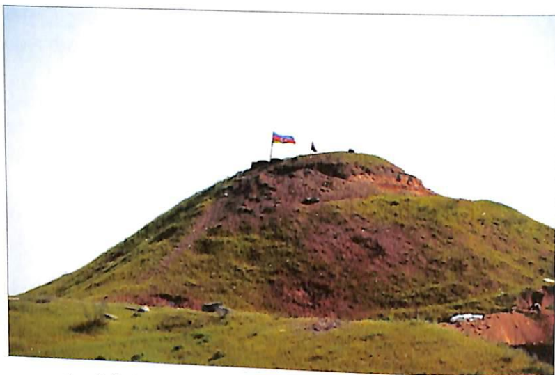
Aprəl döyüşlərində işğaldan azad olunmuş Lələ təpə yüksəkliyi