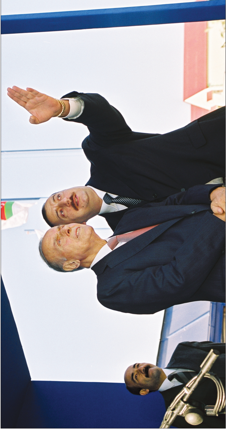
Ümummilli lider Heydər Əliyev: «İnanıram ki, mənim axıra çatdırıbilmədiyim işləri İlham Əliyev uğurla tamamlayacaq».