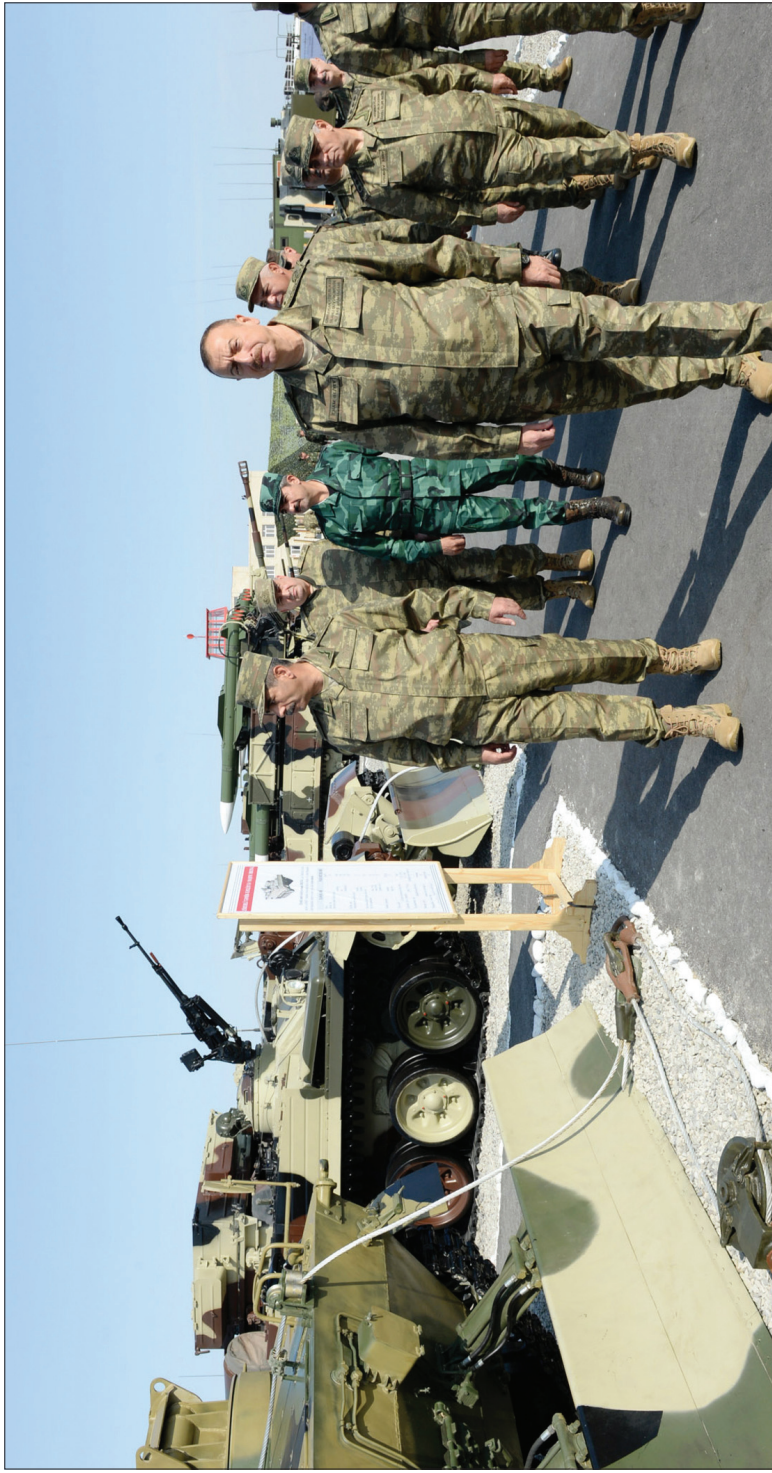
Azərbaycan Ordusu dünyanın ən güclü 50 ordusu sırasında qərar tutur.