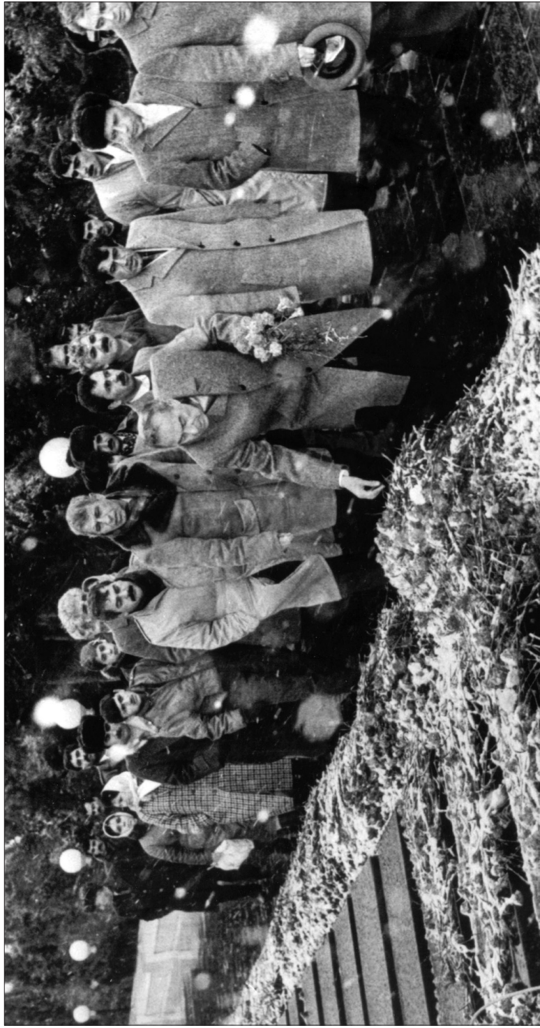
Heydər Əliyev: «Mən də, övladlarım da Azərbaycanın müstəqilliyi üçün hər an şəhid olmağa hazırıq».