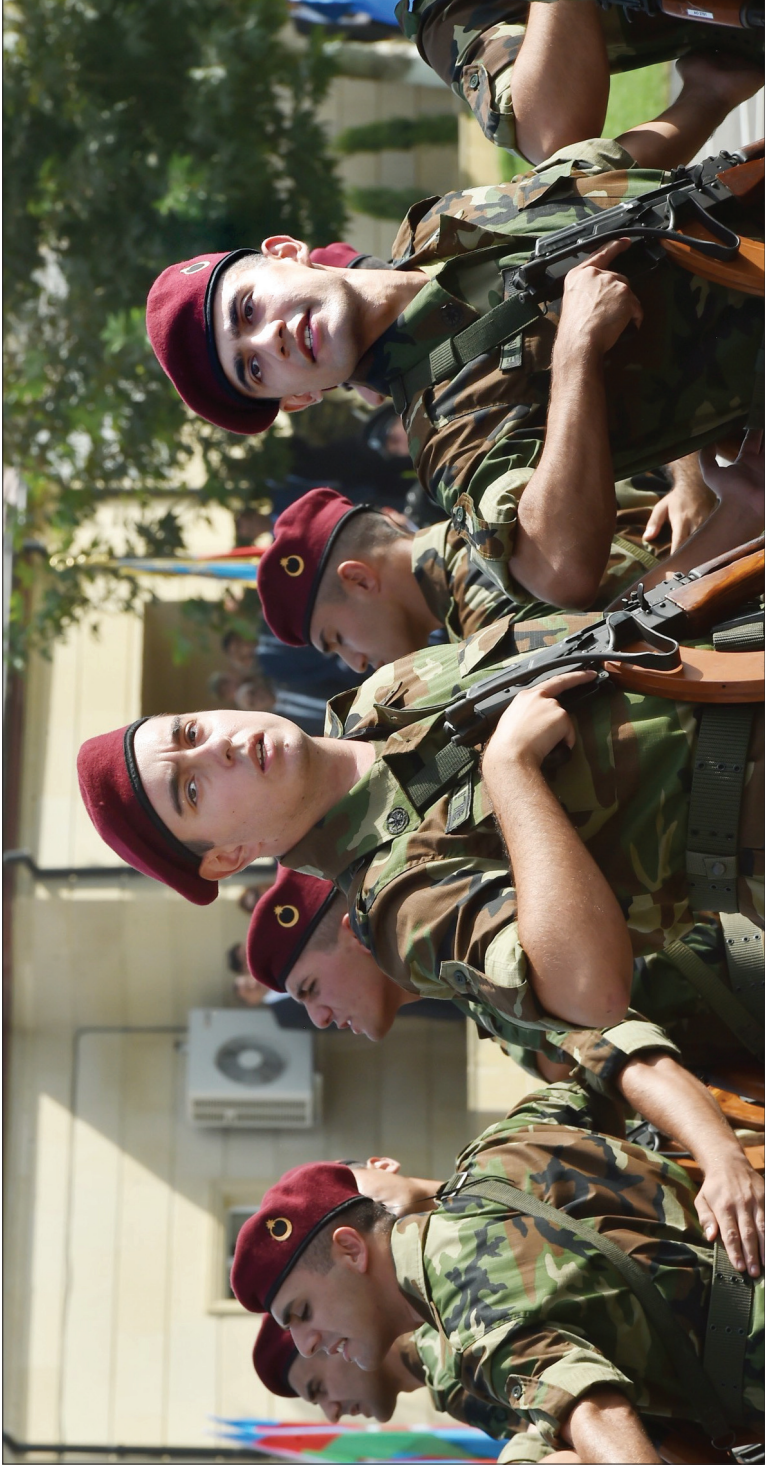
Azərbaycan Ordusunun sıralarında gənc Heydər Əliyev mətin addımlarla irəliləyir.