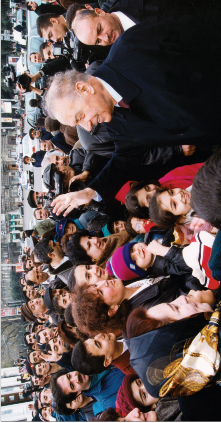
Milli-siyasi intibahımızın başlanğıcı Heydər Əliyevlə bağlıdır.