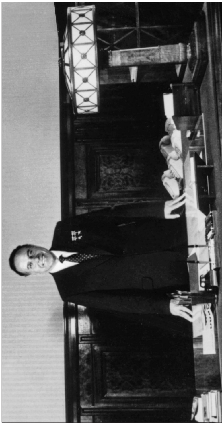
Heydər Əliyev Azərbaycan xalqının iftixar və qürur mənbəyidir.