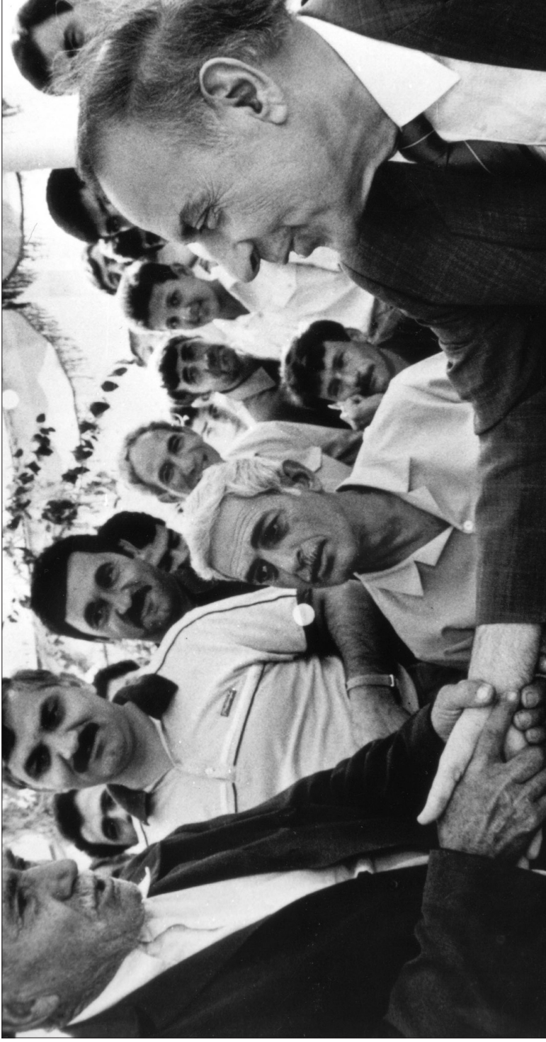
Mən öz məndəli həyatımı xalqımın bu gününə və sabahına həsr etmişəm.