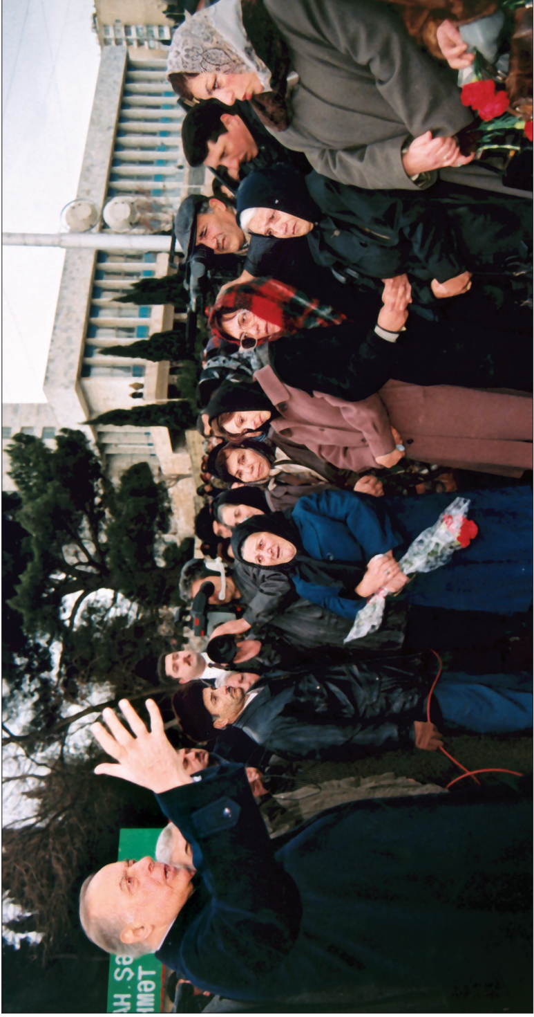
Heydər Əliyev: «Azərbaycanın dövlət müstəqilliyi Azərbaycan xalqının milli sərvətidir».