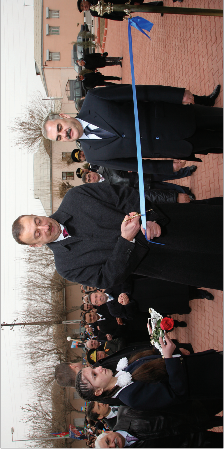
Azərbaycan Respublikasının Prezidenti İlham Əliyev: «Heydər Əliyev blokada şəraitində yaşayan Naxçıvanı xilas etdi, naxçıvanlılar da Azərbaycanın xilaskarını qorudu».