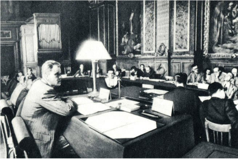
Paris Sülh Konfransında. Belarus Xarici İşlər Naziri Bolqarıstan məsələsi üzrə komissiyaya rəhbərlik edir

Amerika xarici siyasəti Yuqoslaviya cümhuriyyətlərinə qarşı böyük hücumlara keçmişdir. Sülh Konfransında Amerika və Yuqoslaviya nümayəndələri bir yerdə sülh məsələləri haqqında müzakirə edən zaman Amerikanın hərbi təyyarələrinin endirilməsindən sonra, o dövlətin Yuqoslaviya cümhuriyyətlərinə verdiyi "ultimatum" atom siyasətinin nümunələrindən hesab olunurdu. Yuqoslaviya və Amerika münasibətlərində üz verən bu hadisə yeni müharibə tərəfdarları üçün geniş bir fəaliyyət meydanı yaratmaqda idi. Vaşinqton siyasətçilərinin bu bacarıqsız əməlləri bütün dünyanı güldürəcək qədər yüngül və məsxərə idi.