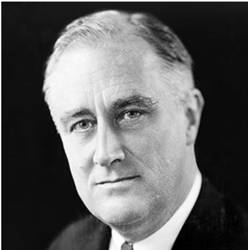
ABŞ prezidenti Franklin Ruzvelt (4 mart 1933 – 12 aprel 1945)