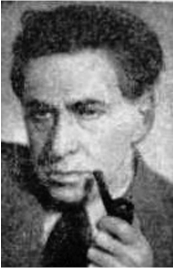
İlya Erenburq. 1891-1967

Məşhur Sovet yazıçısı və Fransa xalqının məşhur dostu İlya Erenburq Parisdən ayrılarkən “səfirələr klubu” tərəfindən düzənlənmiş böyük bir yığıncaqda