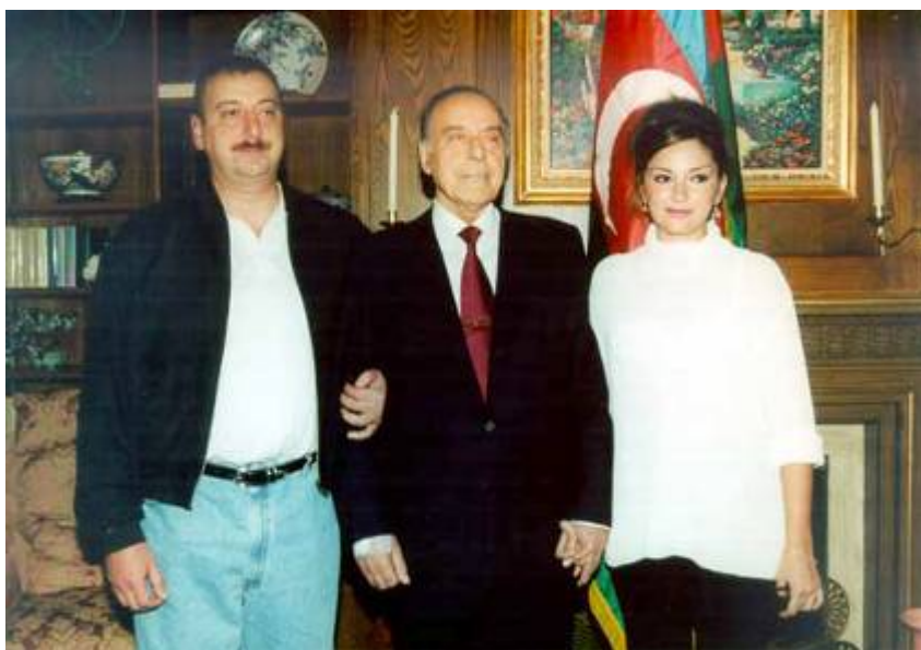
Вақт. 1996-сӣ ил