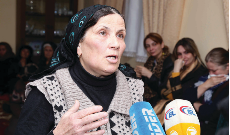
Ana vüqarla, fəxrlə danışırdı