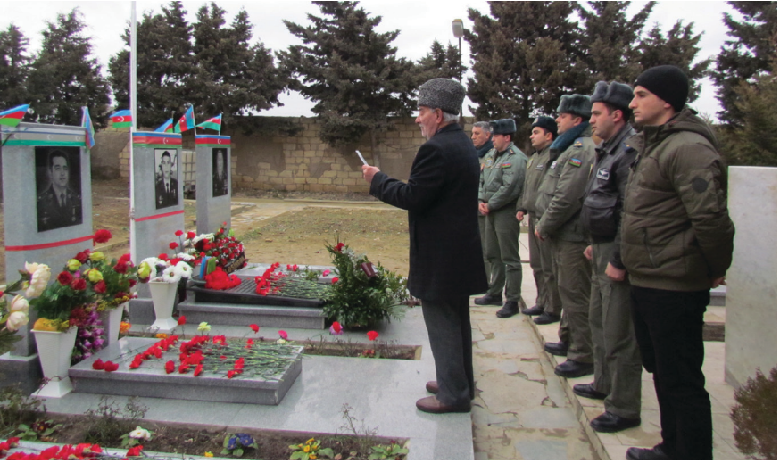
Hərbiçilər Şəhid dostlarını yad edirlər