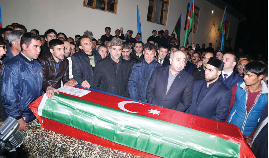
Əbu Bəkirin nəşinin gətirilməsi