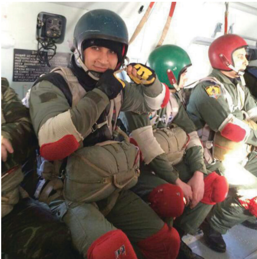
Əbu Bəkr təlim vertalyotunda