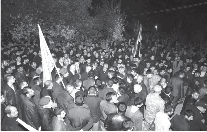
Qəhrəman Şəhidi el qarşılıyır