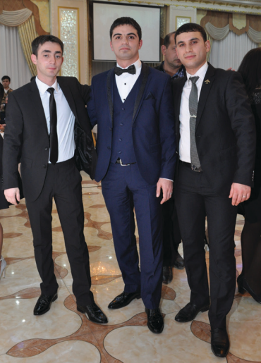
Dostu Sadiqin toyunda