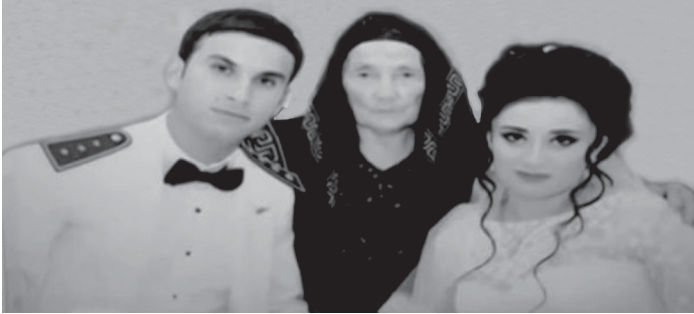
Şəhid nəvənin Şəhid nəvəsi