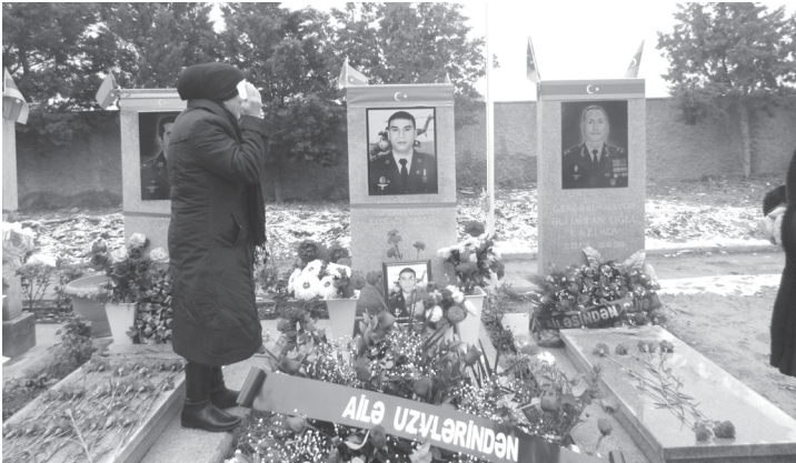
Düzər tər qərənfıl məzarı üstə, Oxşayar balasın Şəhid anası