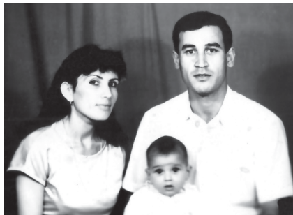
Bəxtəvər günlərdən xatirə

Evimizdə qız uşağı olmadığı üçün uşaqlar ev işlərində analarına yardım edirdilər. Biz səhər işə gedəndə anası bölgü edərdi. Əbu Bəkr öz işlərini