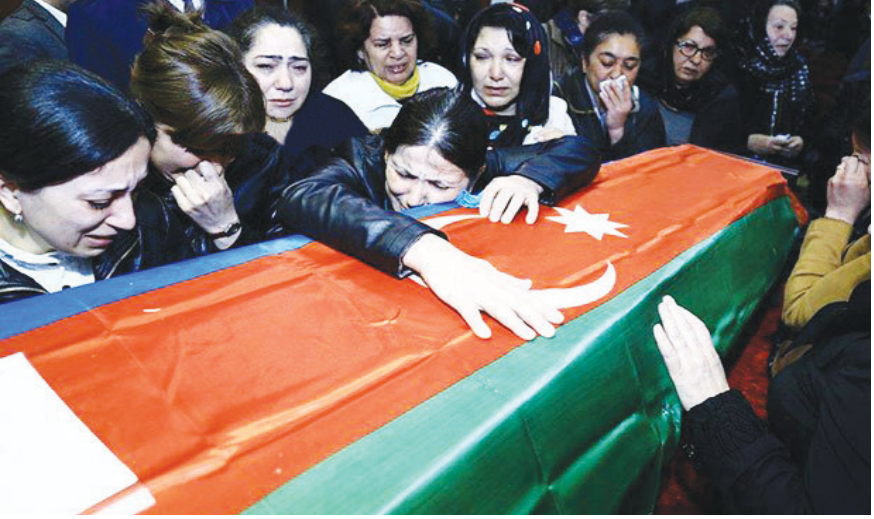
TTM – də vida anı