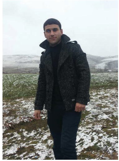
Bu torpağın hər qarışı doğmadır