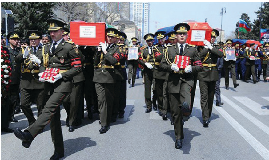
Şəhidlər Fəxri xiyabana aparılır