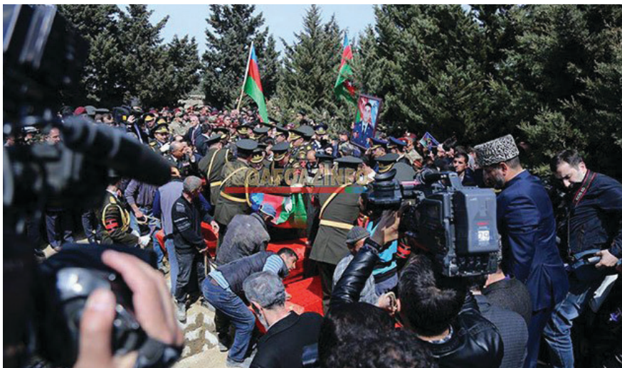
II Fəxri xiyabanda dəfn zamanı