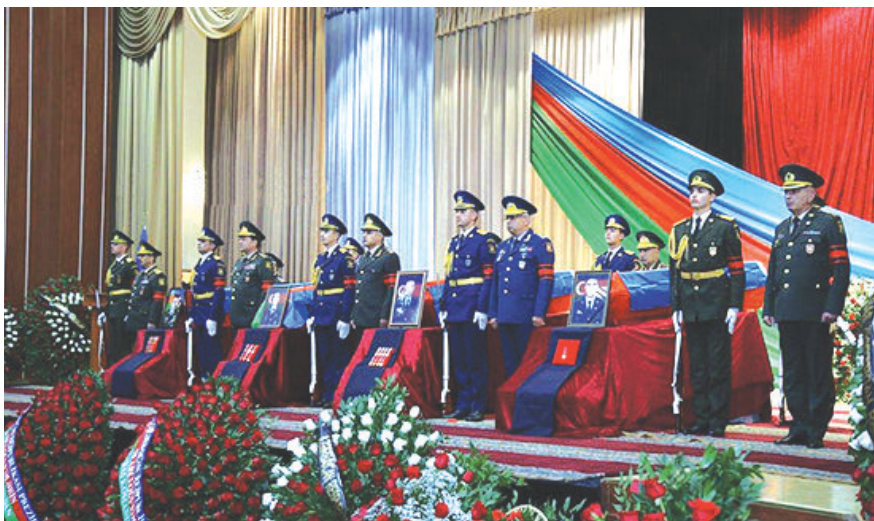
TTM – də vida mərasimi