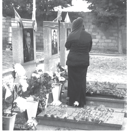
Püşkünə ayrılıq düşən gəlin...

Qayıtdı. İlk dərs günü sinfə girəndə fikirləri qarışıq