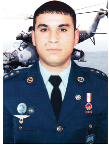
Əbu Bəkr rəsmi medallı şakli