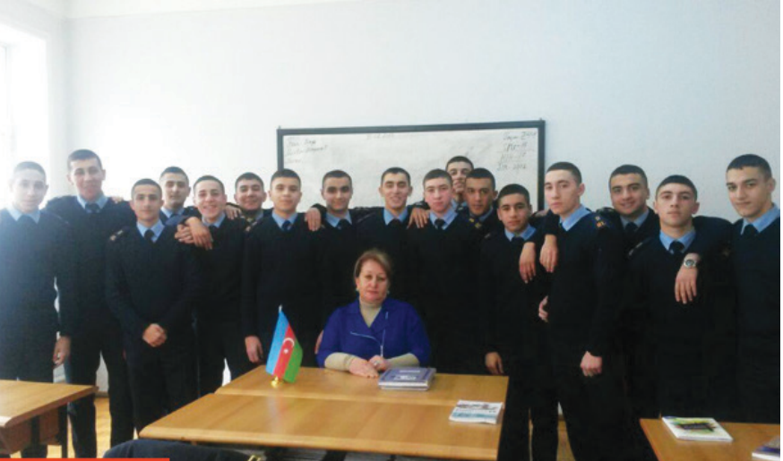
Kursantlar dərslər zamanı