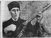
Aşiq Mirzə Bayramov