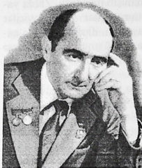
Xalq şairi Hüseyn Arif