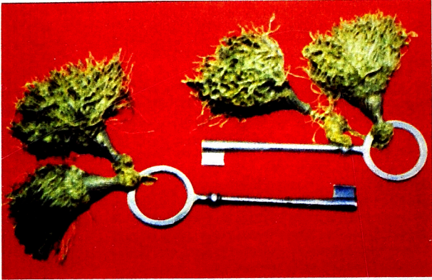
Şuşanın qala qapısının açarlari