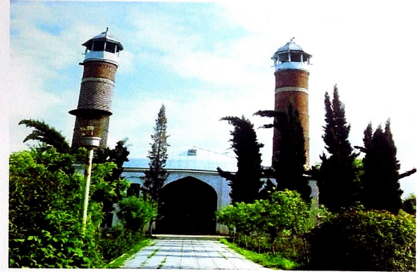
Şuşada yuxarı Gövhər ağa məscidi