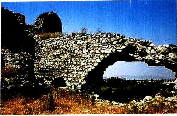
Şuşa qalasının qala divarlarının bir hissəsi