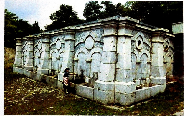
Xan qızı Natəvanın bulağı