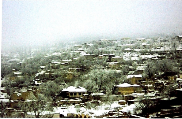
Şuşada qış fəslı