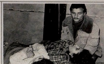
Pendudukan Karabakh oleh Armenia. Seorang anak menemukan jenazah anggota keluarganya yang sudah membeku.