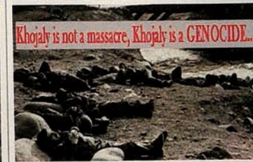
Occupation of Karabakh by Armenia. Inhabitants of Khojaly town.