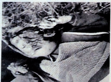
Occupation of Karabakh by Armenia. Children are among the dead frozen bodies.