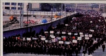
Demo untuk Keadilan bagi Khojaly.