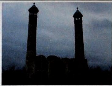
Occupation of Karabakh by Armenia. A mosque has been destroyed and burned down.