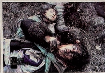
Occupation of Karabakh by Armenia. Field is full of dead families.