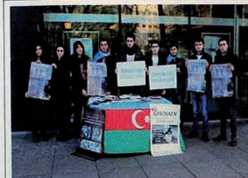
"Justice for Khojaly" campaign in Edinburgh.