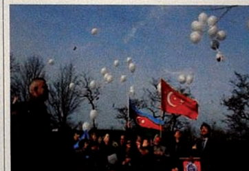
Kampanye “Keadilan bagi Khojaly” di Netherlands.