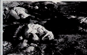
Pendudukan Karabakh oleh Armenia. Ladang dipenuhi jenazah.