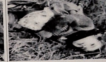
Occupation of Karabakh by Armenia. Innocent children have been targeted too.