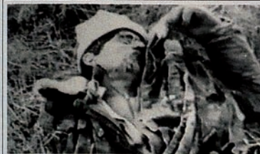
Pendudukan Karabakh oleh Armenia. Ladang dipenuhi jenazah.