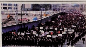
"Justice for Khojaly" march.