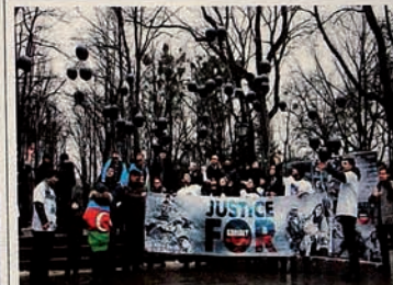
"Justice for Khojaly" campaign in Italy.