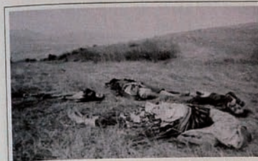
Occupation of Karabakh by Armenia. People have been massacred while trying to refuge.