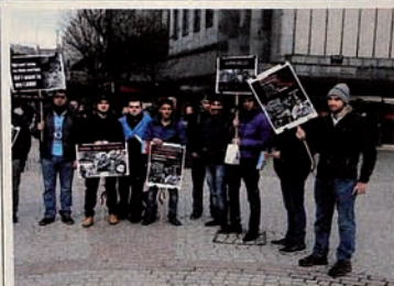
"Justice for Khojaly" campaign in Aberdeen.