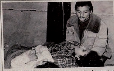
Occupation of Karabakh by Armenia. A man just found frozen dead bodies of his family members.