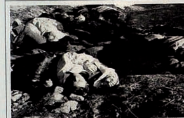
Occupation of Karabakh by Armenia. Field is full of dead people.