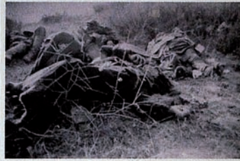
Pendudukan Karabakh oleh Armenia. Ladang dipenuhi jenazah penduduk sipil.