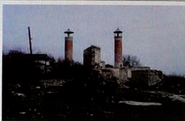
Occupation of Karabakh by Armenia. Cities burned down, mosques have been destroyed.