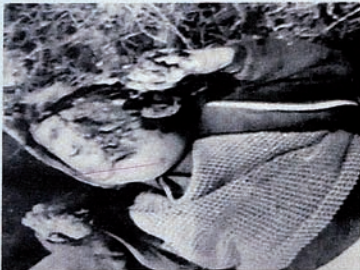
Pendudukan Karabakh oleh Armenia. Ada jenazah anak-anak di antara jenazah-jenazah yang membeku.