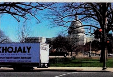
"Justice for Khojaly" campaign in Washington DC.