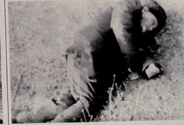
Occupation of Karabakh by Armenia. Even no mercy to helpless elder people.