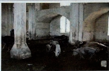
Pendudukan Karabakh oleh Armenia. Masjid-masjid yang dihancurkan digunakan sebagai kandang babi.