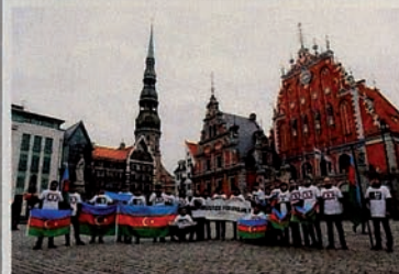
Kampanye “Keadilan bagi Khojaly” di Latvia.