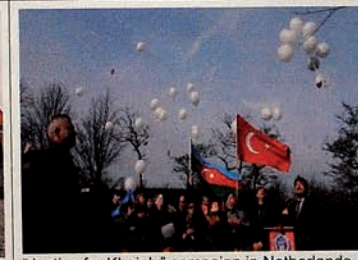
"Justice for Khojaly" campaign in Netherlands.