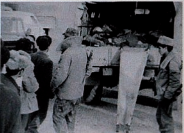
Pendudukan Karabakh oleh Armenia. Jejak-jejak jenazah pembantaian yang menunggu untuk diidentifikasi dan dikuburkan.