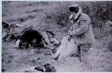
Pendudukan Karabakh oleh Armenia. Ladang dipenuhi jenazah penduduk sipil.