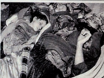
Occupation of Karabakh by Armenia. Whole family has been massacred.