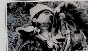
Occupation of Karabakh by Armenia. Field is full of dead bodies.