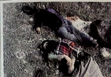
Occupation of Karabakh by Armenia. Field is full of dead civilians.