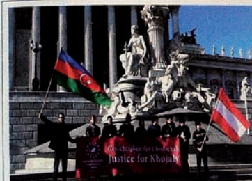
"Justice for Khojaly" campaign in Austria.