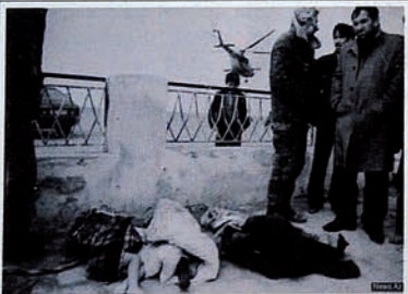
Occupation of Karabakh by Armenia. Dead bodies of a family.