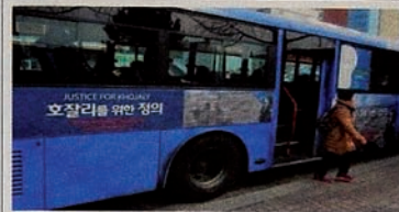
Kampanye “Keadilan bagi Khojaly” di Asia.