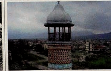
Occupation of Karabakh by Armenia. Cities burned down, mosques have been destroyed.