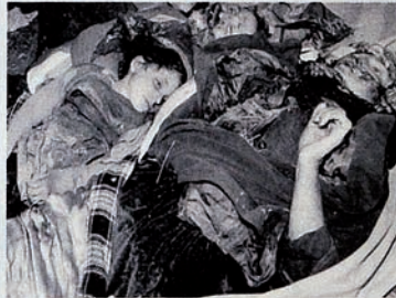
Pendudukan Karabakh oleh Armenia. Seluruh keluarga dibantai.