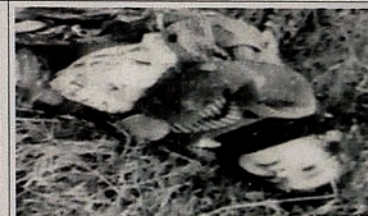
Pendudukan Karabakh oleh Armenia. Anak-anak yang tidak bersalah juga dijadikan sasaran.