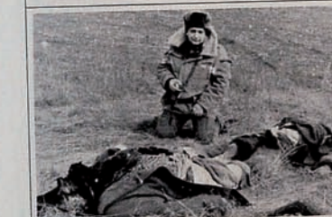
Occupation of Karabakh by Armenia. Field is full of dead civilians.