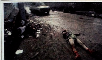
Occupation of Karabakh by Armenia. Street of Khojaly town.