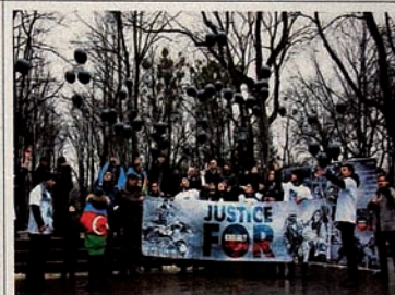
Kampanye “Keadilan bagi Khojaly” di Italy.