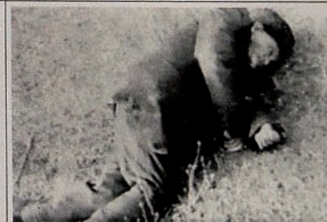
Pendudukan Karabakh oleh Armenia. Tidak ada ampun, bahkan bagi penduduk usia lanjut yang tidak berdaya.