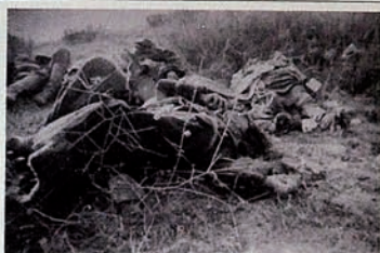
Occupation of Karabakh by Armenia. Field is full of dead civilians.