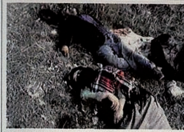
Pendudukan Karabakh oleh Armenia. Ladang dipenuhi jenazah penduduk sipil.