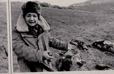
Occupation of Karabakh by Armenia. A man shows several dead bodies.