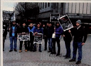
Kampanye “Keadilan bagi Khojaly” di Aberdeen.