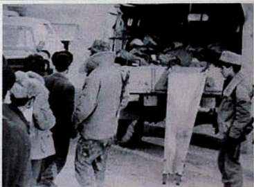
Occupation of Karabakh by Armenia. A track of massacred bodies waiting for identification and burial.