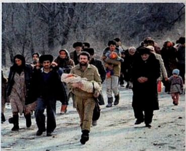
Pendudukan Karabakh oleh Armenia. Orang-orang mencoba mengungsi dari tempat pembantaian.