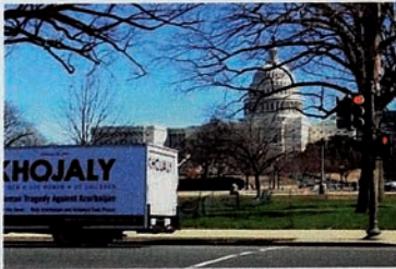
Kampanye “Keadilan bagi Khojaly” di Washington DC.