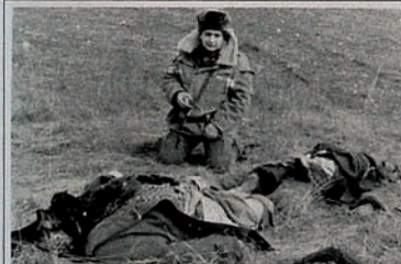
Pendudukan Karabakh oleh Armenia. Ladang dipenuhi jenazah penduduk sipil.