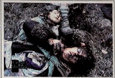
Pendudukan Karabakh oleh Armenia. Ladang dipenuhi jenazah anggota keluarga.