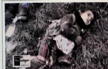
Occupation of Karabakh by Armenia. Children have been massacred too.