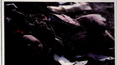
Pendudukan Karabakh oleh Armenia. Jalan di Kota Khojaly.