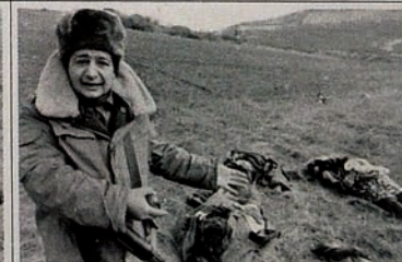
Pendudukan Karabakh oleh Armenia. Ladang dipenuhi jenazah penduduk sipil.