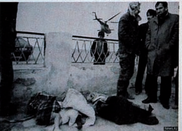
Pendudukan Karabakh oleh Armenia. Jenazah satu keluarga.