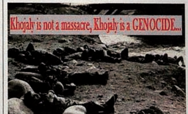
Pendudukan Karabakh oleh Armenia. Para penduduk Kota Khojaly.