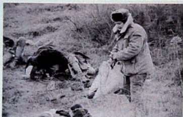
Occupation of Karabakh by Armenia. A man looks at dead bodies.