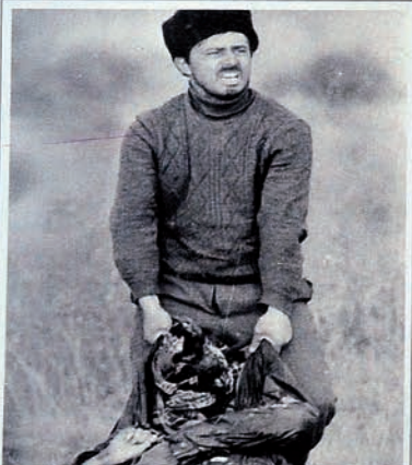
Occupation of Karabakh by Armenia. Trying to take bodies of his family.