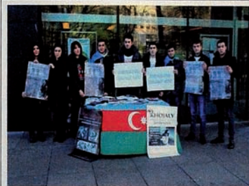
Kampanye “Keadilan bagi Khojaly” di Edinburgh.