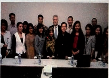
Indonesian youths join "Justice for Khojaly" campaign.