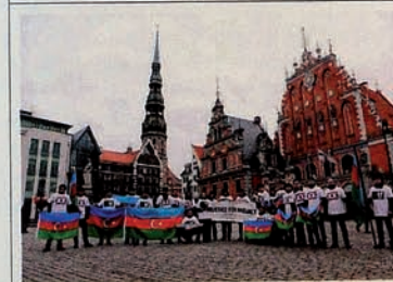
"Justice for Khojaly" campaign in Latvia.