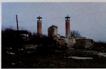
Pendudukan Karabakh oleh Armenia. Kota-kota dibakar habis, masjid dihancurkan.