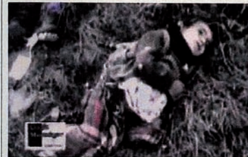
Pendudukan Karabakh oleh Armenia. Anak-anak juga dibantai.