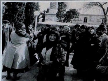
Pendudukan Karabakh oleh Armenia. Orang-orang mengungsi ke masjid dengan harapan bahwa mereka tidak akan dibunuh di tempat ibadah.