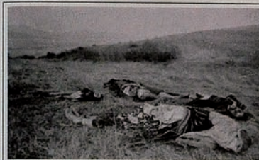
Pendudukan Karabakh oleh Armenia. Orang-orang dibantai pada saat melarikan diri.