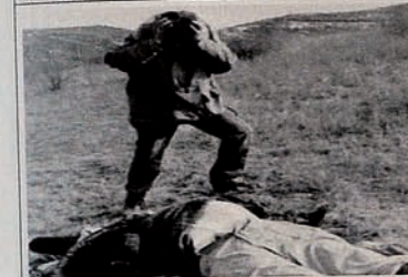
Occupation of Karabakh by Armenia. Shocked of brutal killing at a village.