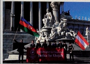
Kampanye “Keadilan bagi Khojaly” di Austria.