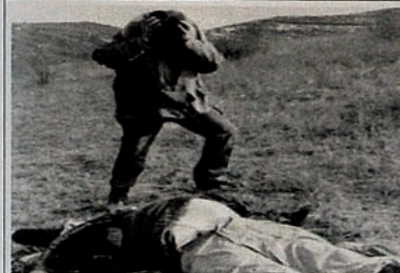
Pendudukan Karabakh oleh Armenia. Terkejut dengan pembunuhan yang keji di desa.