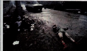
Pendudukan Karabakh oleh Armenia. Jalan di Kota Khojaly.