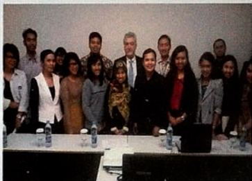
Para pemuda Indonesia bergabung dalam kampanye “Keadilan bagi Khojaly”.