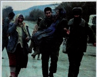
Occupation of Karabakh by Armenia. People are trying to refuge from massacre.