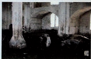
Occupation of Karabakh by Armenia. Destroyed mosques have been used as shelters for pigs.