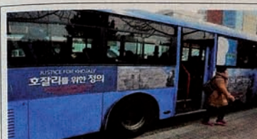
"Justice for Khojaly" campaign in Asia.