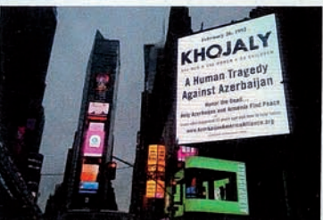
"Justice for Khojaly" campaign in New York.