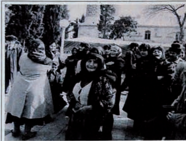
Occupation of Karabakh by Armenia. People take refuge in mosque with hope of not to be killed at holy place.