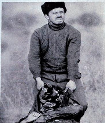
Pendudukan Karabakh oleh Armenia. Seseorang mencoba mengangkat jenazah keluarganya.