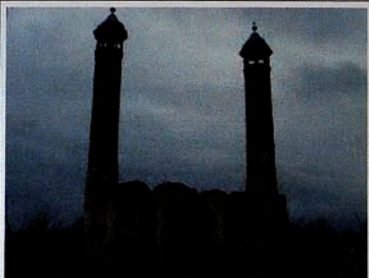
Pendudukan Karabakh oleh Armenia. Masjid telah dihancurkan dan dibakar habis.