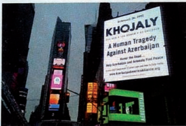
Kampanye “Keadilan bagi Khojaly” di New York.