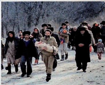
Occupation of Karabakh by Armenia. People are trying to refuge from massacre.