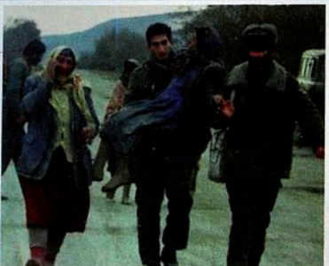
Pendudukan Karabakh oleh Armenia. Orang-orang mencoba mengungsi dari tempat pembantaian.