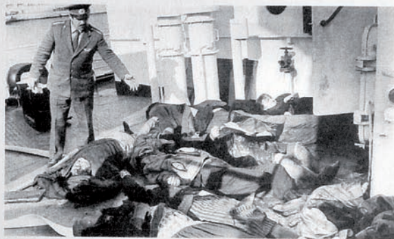
Преступление, совершенное армянской террористической организацией «АСАЛА»