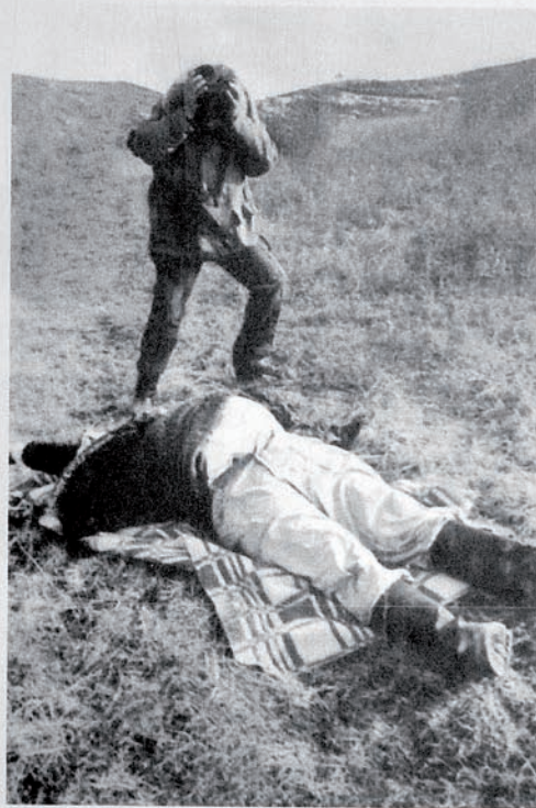
Азербайджанец, которому армянские террористы отрубили голову