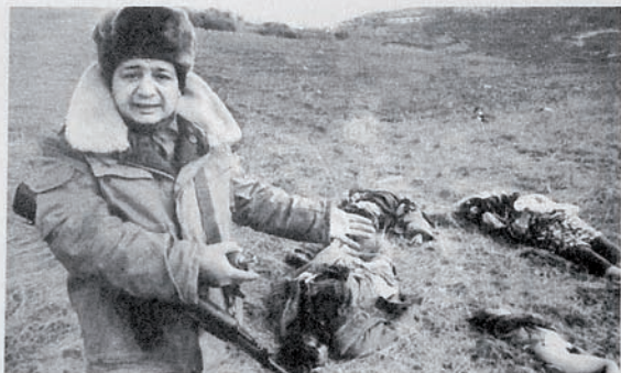
Ходжалы: одна из семей, оказавшихся жертвами армянского терроризма