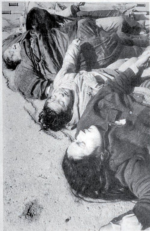
Жертвы армянского террора в Ходжалы

Сегодня, 26 февраля 2012 года на 20-й годовщине трагедии мы вновь с глубокой скорбью поминаем жертв Ходжалы: 613 убитых (включая трупы, которых невозможно опознать) и более 1000 пропавших без вести, которые тоже считаются мертвыми. Молимся за них и еще раз заверяем близких и родных погибших, весь азербайджанский народ в том, что справедливость восторжествует! Что идеи, за которые отдали свою жизнь ходжалинские шехиды и герои, в свободной и независимой Азербайджанской Республике будут жить вечно.