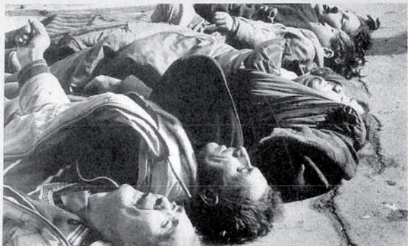
Азербайджанцы, подвергшиеся в Ходжалы воздействию химического оружия