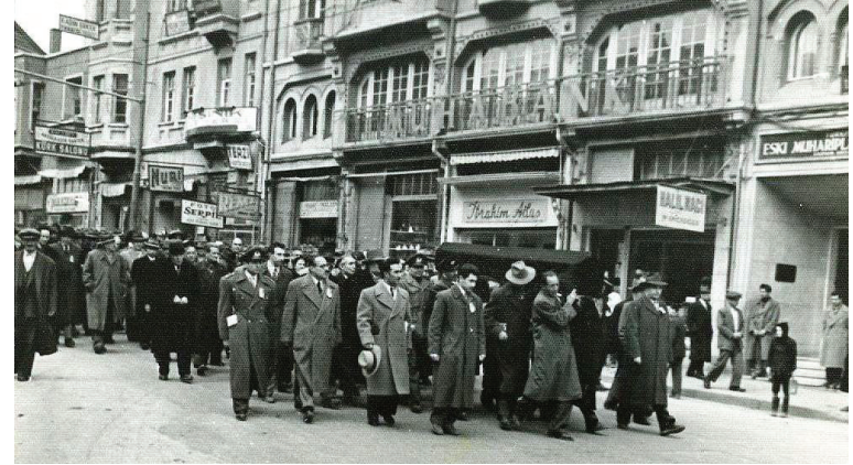
Похороны М.Э. Расулзаде, Анкара 1955г.