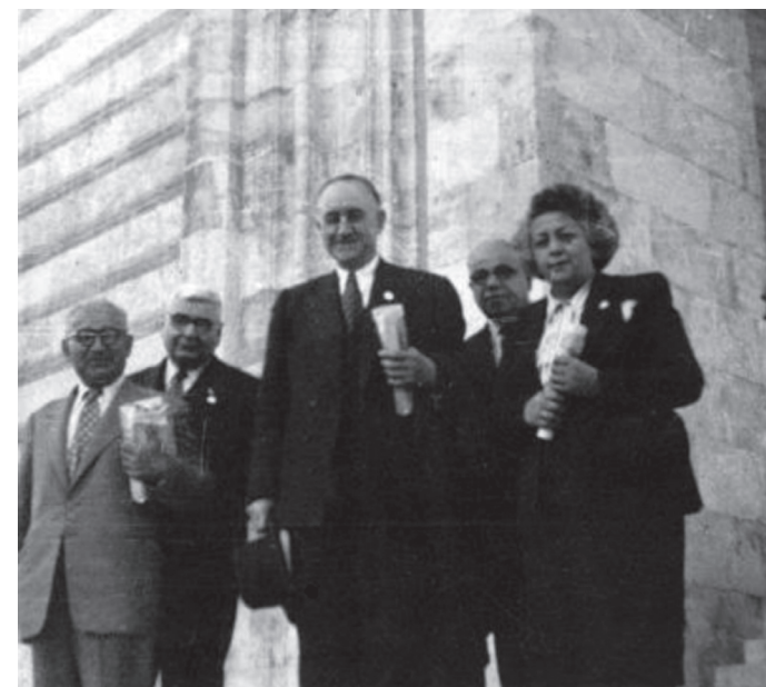
М.Ə. Расулзаде у мавзолея Ататюрка. 50-е годы.