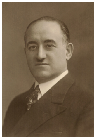
М.Ə.Расулзаде, Париж 1935 г.