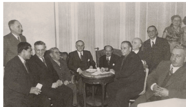
М.Ə.Расулзаде среди азербайджанских политэмигрантов. Анкара 50-е годы.