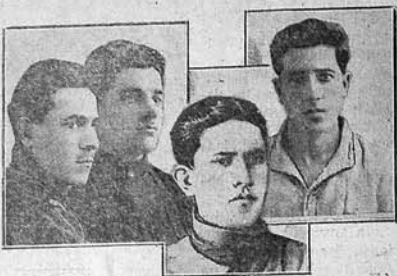
«JENI JOL» qəzetəsinin zərbəci kəndlilərdən bir qrupu.

Oqtjabrın 16-da, AQ (b) F Bakı Qəzetəsinin orqanı və Bakı proletariyatının kytlovları qəzetəsi «JENI JOL» öz on illiyini bəyram edir. «JENI JOL» qəzetəsinin on illiyi yeni türk əlifbasının on illiyidir. «JENI JOL» qəzetəsi on il bundan əvvəl 1922-nci ildə, sentjabrın 21-ndə təşkil edilmişdir. O zaman mütəvəllim hökumətindən qurtulan Suralar Azərbaycan, mədəni inqilab məsələləri ilə məşğul olmaq imkanı tapmış və buna görə, türk əlifbasının lətinləşdirilməsi məsələsi birinci sırada çəkilmişdi.