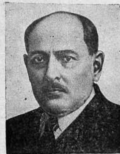
NƏRİMAN NƏRİMANOV JOLDAS.