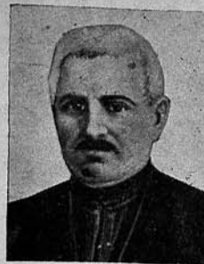
1857-nci ildən latın əlifbasının həyata keçirilməsi uğrunda mübarizə aparan M. F. AXUNDOV.