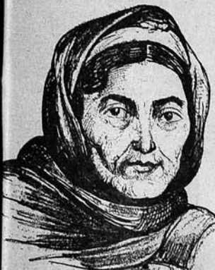
«Rot Front» bəzərəq uqrunda əzry zərbəci «təbarən» otis Ucuvaq qolxozu üzvi Bəhə Məhəmməd qəz.

Gojcaq rəjonunda «JENI JOL» briqadası qolxozlarda 11 istehsalat briqadası təşkil edir. Alpaüt kəndində