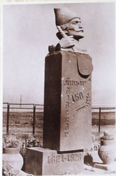
Aşiq Ələsgərin məzarı. (Göyçə mahalı, Ağkilsə kəndi)