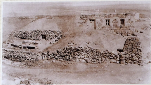
Aşıq Ələsgər yurdunun xarabalıqları (Göyçə mahalı, Ağkilsə kəndi).

tuarında geniş yer tutur, şənliklərin, məclislərin bəzəyinə çevrilməkdədir. Aşıq Ələsgərin şənşöhrəti Azərbaycan hüdudlarını çoxdan aşmışdır. Ustad sənətkarımızın adı və yaradıcılığı indi qardaş Türkiyədə, İranda, Gürcüstanda, Dağıstanda, eləcə də Orta Asiya Respublikalarında da məşhurdur.