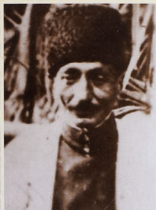
Aşiq Nağı (Aşiq Ələsgərin şayiirdi)

Haqqında söylənilən xatirələrdən, dastan-rəvayətlərdən məlum olur ki, o, həm də bəş verəcək bir çox hadisələri əvvəlcədən yuxuda görürmüş. Dədə Qorqud kimi