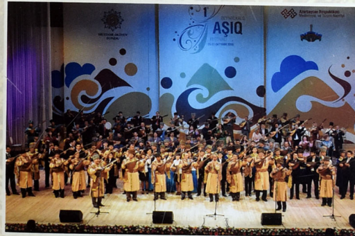
Ustad Aşıq Ələsgər 2010-cu ilin oktyabr ayında Azərbaycanda keçirilən Birinci Beynəlxalq Aşıq Festivalında da hörmət və ehtiramla yad edildi.

İllər ötəcək, qərinələr keçəcək, nəsillər bir-birini əvəz edəcək, lakin 2011-ci ildə 190 illik yubileyini təntənə ilə qeyd etdiyimiz ustad Aşıq Ələsgərin adı qədirbilən xalqımız tərəfindən həmişə hörmət və ehtiramla yad olunacaq, sənət ənənələri uğurla davam etdiriləcəkdir.