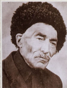
Aşiq Ağayar (Aşiq Ələsgərin şayiirdi)

Aşiq Ələsgərin də alqışı və qarğısı böyük təsir gücünə malik imiş.