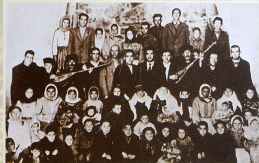
Aşiq Ələsgərin törəmələri