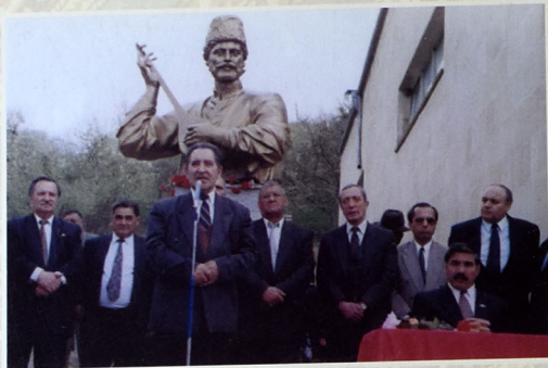
Şəmkirdə Aşiq Ələsgər günləri.

onunla dostluq ələməyi, onu evində qonaq saxlamağı özlərinə şə- rəf sayardılar.