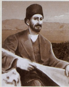
Ustad Aşıq Ələsgər

Aşıq Ələsgər 1821-ci ildə Novruz bayramı günü qədim Göyçə