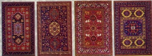
Aşıq Ələsgər yurdunun - Göyçə elinin xalçalarda əbədiləşən naxışları