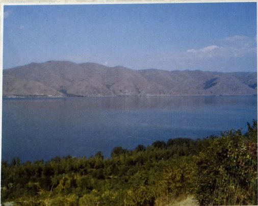
Göyçə gölü (Qərbi Azərbaycan)

Aşıq Ələsgər Azərbaycan aşıq sənəti, milli aşıq poeziyası tarixində şərəfli yer tutan sənətkardır. O, qeyri-adi fitri qabiliyyəti sayəsində yaratdığı müxtəlif səpkili, müxtəlif məzmunlu sənət incilərində özünəməxsus bədii boyalarla ifadə etdiyi ümumbəşəri fikirlərlə müqəddəs sənətin zirvəsinə yüksəlmişdir. Qüdrətli el sənətkarının yaratdığı əsərlər bu gün də aşıqlarımızın reper-