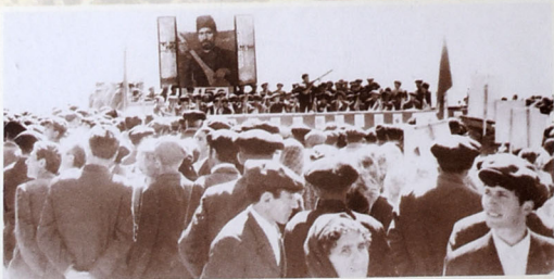
Aşiq Ələsgərin 150 illiyinə həsr olunmuş təntənəli mərasim. (Göyçə mahalı, Ağkilsə kəndi, 1972-ci il)

oxumaları ilə vəzifələrini bitmiş hesab eləməirdi. Onun nəzərində aşıq "oturub-durmaqda ədəbin bilən", "xalqa həqiqətdən mətləb qandırın", "şeytanı öldürüb, nəfsin yandırın", "danişdığı sözün qiymətin bilən", "mərifət elmində dolu", "el içində pak oturub, pak duran", "dalisınca xoş sədəli gərəkdə".