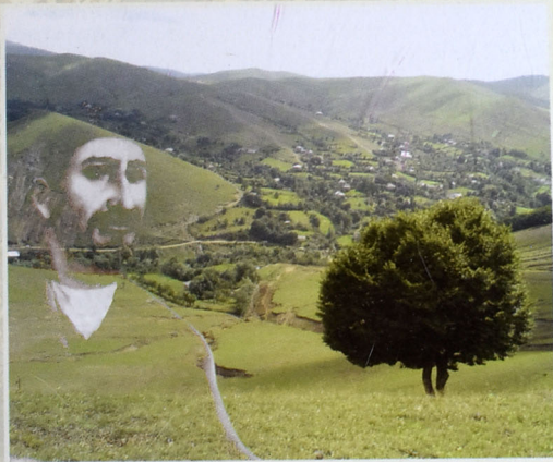
Hamı bu yaylaqda yaylayan ellər?! Görəndə gözümdən car oldu sellər.