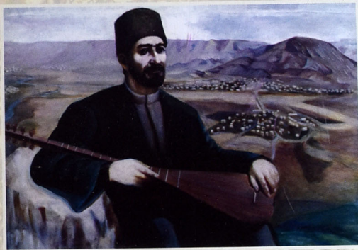
Aşiq Ələsgərin portreti Rəssam: Natə İslam qızı (Aşiq Ələsgərin nəticəsi)