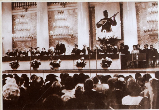
Aşiq Ələsgərin 150 illiyinə həsr olunmuş təntənəli yubiley gecəsi. (İtifaqlar Evinin Sütunlu salonu, Moskva, 1972-ci il)

"Yaxşı hörmət ilə, təmiz ad ilə" "Qafqaz elini" dolanan, qo-