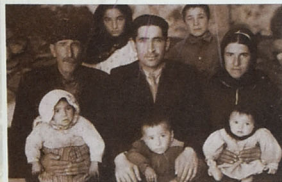
Aşiq Talib doğmaları arasında.

XX əsr öz gəlişi ilə xal- qımızın tarixinə faciəli ha- disələr də gətirdi. Bu faci- cələri yaşayan böyük sən- ətkarın həyatında da ağı- rılı-acılı günlər az olma- mışdır. 1905-ci ildə dün- yada baş verən ictimai-si- yasi çalxantılar, Qafqaz- da isə ermənilərin törət- dikləri fitnə-fəsadlar və bunun acı nəticələri Dədə Ələsgərin narahatlığına, zəmanədən acı-acı şika- yətəlməyinə səbəb ol- muşdur.