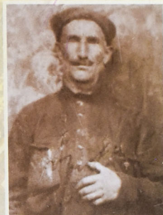
Aşiq Qiyas (Aşiq Ələsgərin şayiirdi)