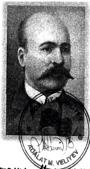
Джалил Мамедкулизаде (1869-1932)