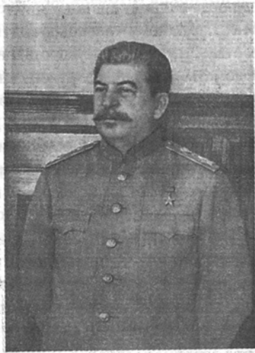
Первый заместитель Председателя Государственного Совета И. В. Сталин.

Наш советский народ не жалел сил и труда во имя победы. Мы пережили тяжёлые годы. Но теперь каждый из нас может сказать: мы победили. Отныне мы можем считать нашу отчизну, избованной от угрозы немецкого нашествия на западе и японского нашествия на востоке. Наступил долгожданный мир для народов всего мира.