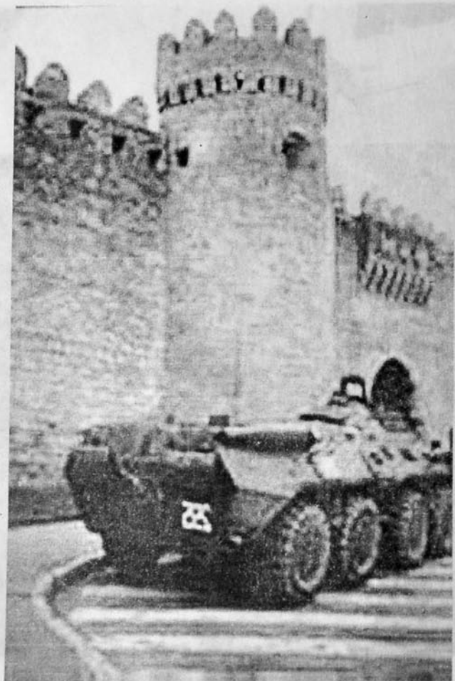
Pusquda dayanıb, «şığımağa» hazırlaşan «Qızıl ordu»nun hərbi maşını...