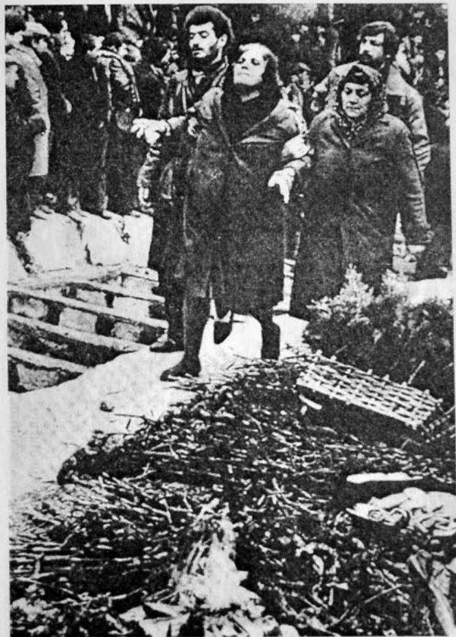
Şəhidlər torpağa tapşılır... Analar isə müsibətin ağırlığına tab gətirə bilmirlər...