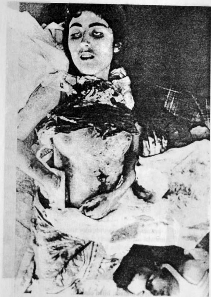
Şahidlik «zirvəsində» əbədi yuxuya getmiş gözəl...