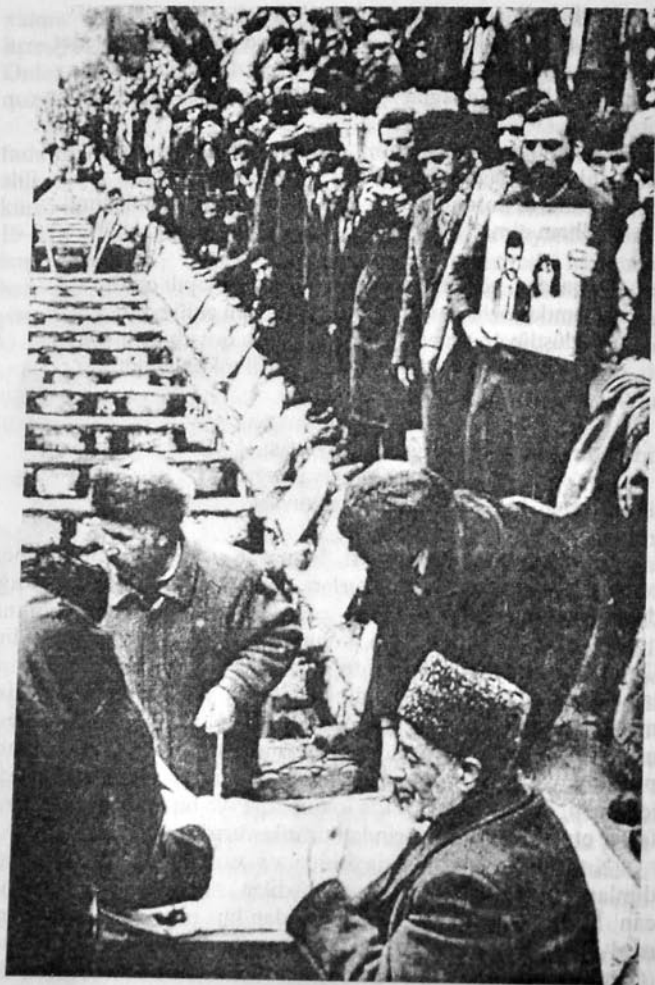
Sıra ilə qazılmış qəbirlər «sahiblərini» gözləyir...